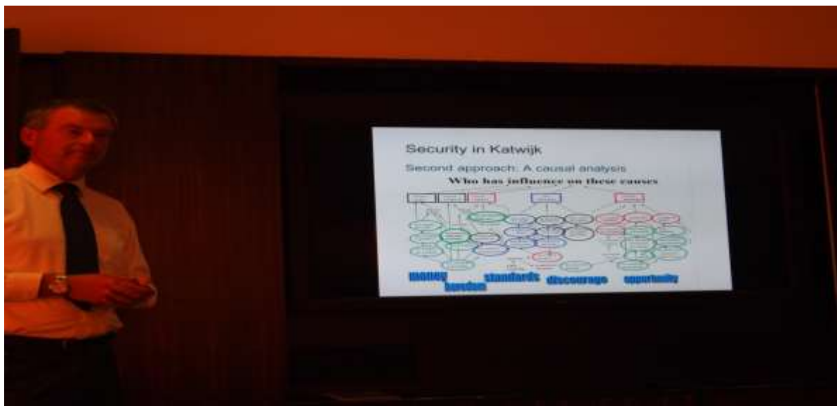
Zdjęcie 5. Przedstawiciel burmistrza Katwijk.

Za porządek publiczny odpowiedzialny jest burmistrz, który jest także zwierzchnikiem Policji. Do spraw bezpieczeństwa podchodzi się tutaj lokalnie. Podzielono je na 5 sektorów: 1. Bezpieczeństwo sąsiedzkie, 2. Zabezpieczenie firm, 3. Młodzież a bezpieczeństwo, 4. Bezpieczeństwo fizyczne, 5. Integracja a bezpieczeństwo.