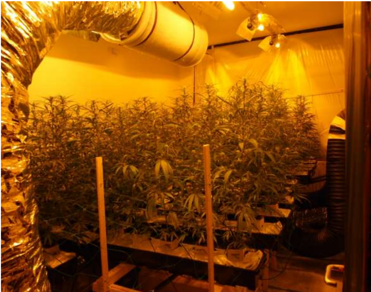
Zdjęcie 13 oraz Zdjęcie 14. Pomieszczenie, w którym znajdowała się plantacja konopi indyjskich

Alternatywą dla obecnego stanu prawnego związanego z zakazem uprawiania marihuany byłoby całkowite zalegalizowanie upraw i dostaw, ale na chwilę obecną nie ma na to zgody ani władz, ani coraz bardziej konserwatywnego w ostatnich latach społeczeństwa. W efekcie klienci i właściciele „coffeshopów” poruszają się częściowo w szarej strefie. Istotnym Elementem wizyty w Holandii, związanym z obszarem zwalczania przestępczości narkotykowej były zajęcia warsztatowe z podziałem na grupy, podczas których zarówno strona polska jak i holenderska dokonały wymiany istotnych z punktu widzenia współpracy międzynarodowej doświadczeń związanych z realizacją zadań w obszarach m .in. zwalczania wyżej wymienionej przestępczości oraz zabezpieczania mienia. Poddano także obopólnej dyskusji zwalczanie działalności zorganizowanych grup przestępczych wywodzących się z terenu Polski, których członkowie zamieszkują na terenie Holandii, gdzie zajmują się produkcją znacznych ilości narkotyków w postaci amfetaminy i marihuany, które następnie są przemywane i wprowadzane do obrotu na terenie Polski.