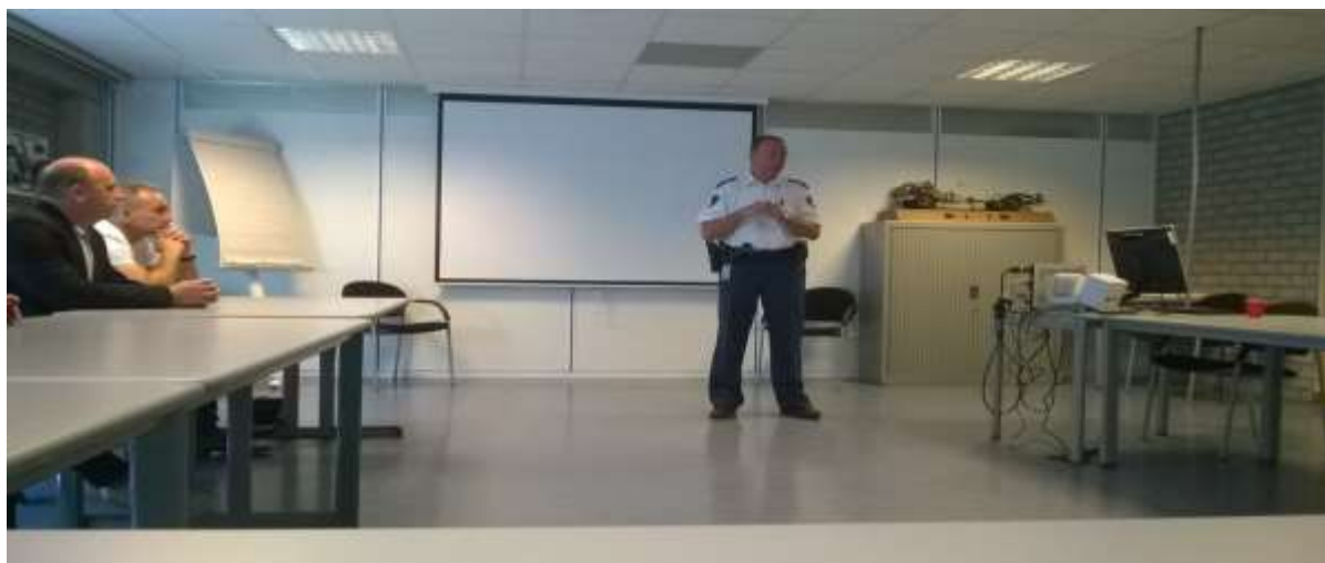
Zdjęcie 1. Spotkanie z funkcjonariuszami holenderskimi w budynku policji w Hadze zaadoptowanym jako magazyn dowodów rzeczowych.

Budynek jest bardzo uporządkowany, znajduje się w nim m.in. wydzielone miejsce za siatką, gdzie na regałach przechowywane są dowody rzeczowe. Aby dostać się do wewnątrz, do otwarcia drzwi potrzebnych jest dwóch funkcjonariuszy, którzy wpisują odpowiedni kod w zamku cyfrowym i korzystają z kart - kluczy. Obiekt jest wyposażony w kilkupoziomowy parking, na którym znajdują się zabezpieczone od sprawców pojazdy (motorowery, motocykle, samochody). W innych pomieszczeniach, przechowywana jest zabezpieczona biżuteria znacznej wartości oraz broń, która stanowi dowód w sprawie.