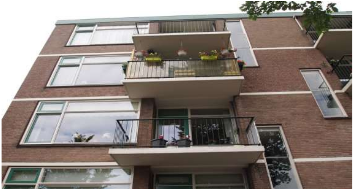
Zdjęcie 12. Miejsce ujawnienia plantacji konopi indyjskich w Hadze

realizowanych przez wielkopolską Policję, co ma bezpośredni związek z faktem, iż technologia wykorzystywana przez grupy przestępcze z Polski została przeniesiona na nasz grunt właśnie z Holandii.