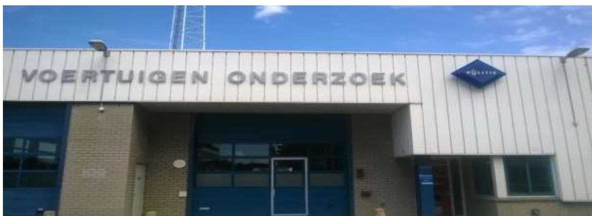
Zdjęcie 2. Budynek, w którym znajduje się magazyn dowodów rzeczowych

Budynek jest bardzo uporządkowany, znajduje się w nim m.in. wydzielone miejsce za siatką, gdzie na regałach przechowywane są dowody rzeczowe. Aby dostać się do wewnątrz, do otwarcia drzwi potrzebnych jest dwóch funkcjonariuszy, którzy wpisują odpowiedni kod w zamku cyfrowym i korzystają z kart - kluczy. Obiekt jest wyposażony w kilkupoziomowy parking, na którym znajdują się zabezpieczone od sprawców pojazdy (motorowery, motocykle, samochody). W innych pomieszczeniach, przechowywana jest zabezpieczona biżuteria znacznej wartości oraz broń, która stanowi dowód w sprawie.