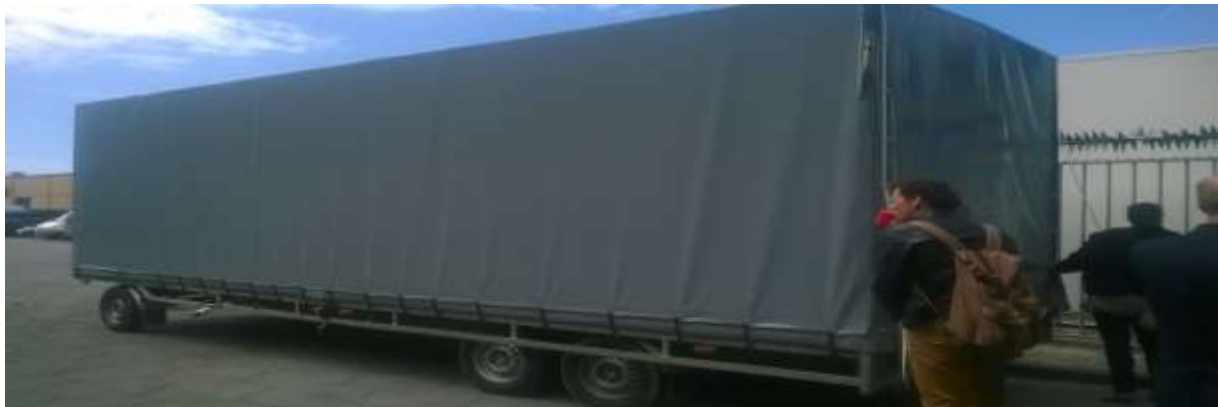
Zdjęcie 4. Zabezpieczona przyczepa z mobilną plantacją

Jednym z ciekawszych pojazdów była przyczepa z zewnątrz pokryta plandeką, której wnętrze zaadoptowano pod kątem uprawy marihuany. Była to mobilna plantacja, stosunkowo trudna do wykrycia.