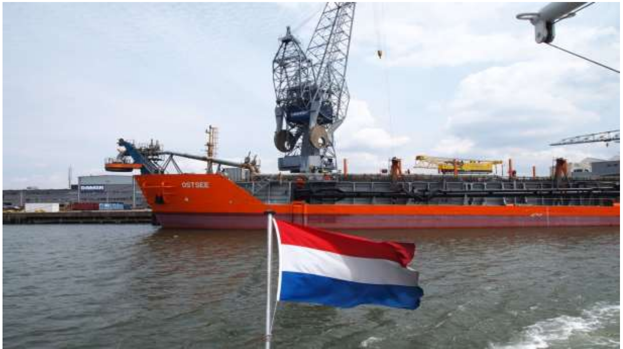
Zdjęcie 8 oraz Zdjęcie 9. Policja portowa i nabrzeże Rotterdamu

Podczas wizyty w Holandii przedstawiono ramy prawne obowiązujące, w tym kraju, związane z zagadnieniem narkotyków i ścigania karnego sprawców przestępstw narkotykowych, rezydujących na terenie Królestwa Niderlandów. Ponadto program wizyty uwzględnił zwiedzanie zarówno Rotterdamu, Amsterdamu jak i Hagi. Na ulicach tych miast bardzo często czuć było specyficzny zapach palonej marihuany, wydostający się z budynków, w których umiejscowione były tzw. „cofeeshopy”. Widząc dziesiątki młodych ludzi palących na ulicach marihuanę, można by wysunąć wniosek, że sprzedaż, posiadanie i zażywanie narkotyków (przynajmniej niektórych) jest w Holandii całkowicie legalne. Rzeczywistość jest jednak odmienna. Holandia od lat siedemdziesiątych prowadzi dosyć liberalną politykę w zakresie narkotyków. W chwili obecnej: