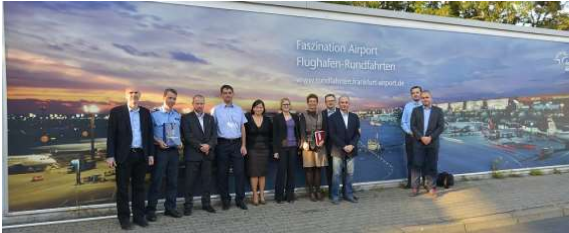
Zdjęcie 19. Spotkanie z przedstawicielem dyrekcji Policji na lotnisku we Frankfurcie

odpowiedzialny za bezpieczeństwo to 8.206 osób (2013 r.). Zadania: nadzór/kontrola osób podróżujących, obrona przed niebezpieczeństwem w ruchu powietrznym na terenie lotniska, utrzymanie bezpieczeństwa i porządku publicznego.