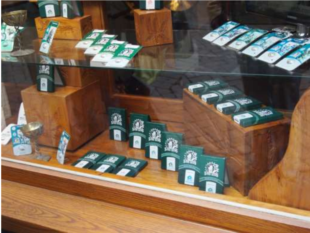
Zdjęcie 10 oraz Zdjęcie 11. Coffeeshopy w Amsterdamie

Przykładem praktycznego podejścia do zwalczania produkcji narkotyków w postaci marihuany było uczestniczenie przez naszą delegację w realizacji sprawy związanej z ujawnieniem przez policjantów holenderskich plantacji marihuany znajdującej się w jednym z lokali w bloku mieszkalnym w Hadze. Policjanci po otrzymaniu anonimowej informacji na temat przestępczego procederu dokonali wstępnych ustaleń, m.in. przeprowadzili pomiar temperatury pomieszczeń przy pomocy specjalnej „ręcznej” kamery termowizyjnej, a następnie na podstawie poczynionych ustaleń uzyskali z prokuratury nakaz przeszukania lokalu. Po wejściu do mieszkania ujawniono i zabezpieczono funkcjonującą w nim pełną infrastrukturę plantacji, składającą się z około 100 roślin konopi indyjskich, lamp, doniczek, systemu nawadniającego, wentylacyjnego, środków ochrony roślin, komponentów zapewniających rozwijającej się roślinie odpowiednio wysoki poziom THC substancji czynnej w dojrzałych kwiatostanach oraz pozostałe elementy infrastruktury. Na miejscu nie zatrzymano sprawcy przestępstwa, czynności w tym kierunku będą podejmowane przez holenderską policję na dalszym etapie sprawy. Należy tutaj zauważyć, że sposób uprawy i zorganizowania plantacji był identyczny jak występujący w sprawach