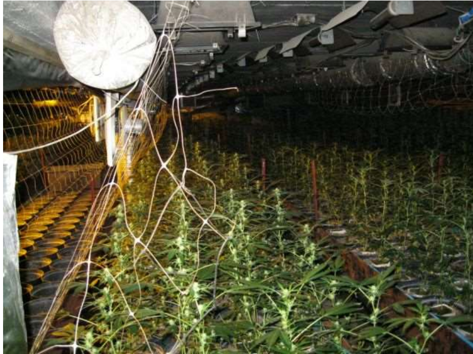
Zdjęcie 15, Zdjęcie 16 oraz Zdjęcie 17. Miejsce ujawnienia plantacji konopi indyjskich w miejscowości Goszczanowiec i Chojno Młyn