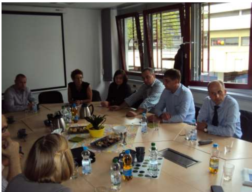
Zdjęcie 18. Delegacja wielkopolskich policjantów w trakcie jednej z prezentacji

Celem zorganizowanego projektu było podniesienie kompetencji i wiedzy funkcjonariuszy w obszarze związanym z organizacją struktur wydziałów niemieckiej policji, zajmujących się zwalczaniem przestępczości gospodarczej, korupcyjnej oraz odzyskiwaniem nielegalnie pozyskanych dóbr. Podczas wyjazdu i przeprowadzonych każdego dnia szkoleń funkcjonariusze mieli możliwość poznania sposobów zwalczania przestępczości gospodarczej i korupcyjnej na przykładach konkretnych postępowań przygotowawczych.