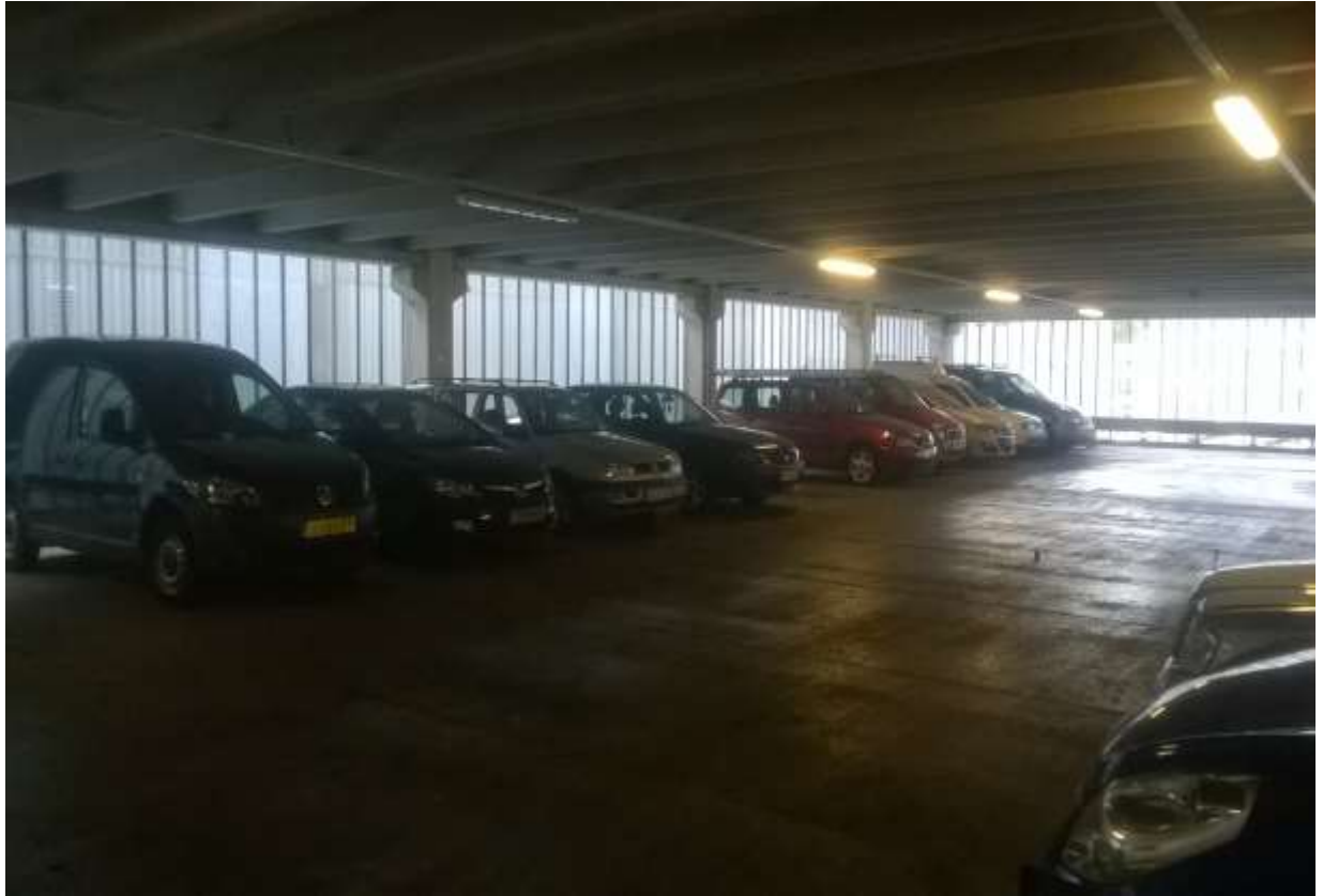
Zdjęcie 3. Parking, na którym przechowywane są dowody zabezpieczone w postaci różnego rodzaju pojazdów

Organom ścigania zależy na jak najszybszym spieniężeniu zabezpieczonych składników majątku, dlatego też po dokonaniu zajęcia wszystkie przedmioty są wyceniane, segregowane oraz opisywane.