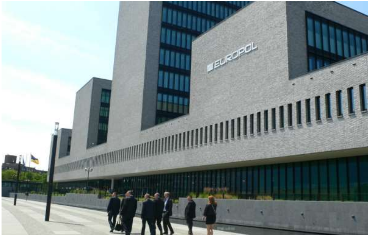
Zdjęcie 6. Nowa siedziba Europolu w Hadze

Celem Europolu jest zapewnienie pełnej efektywności i współpracy między władzami krajów członkowskich w zakresie zapobiegania i zwalczania zorganizowanej przestępczości o charakterze międzynarodowym.