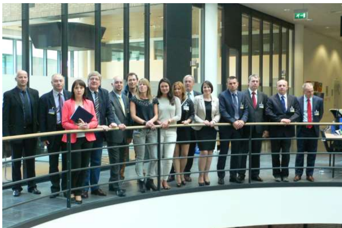
Zdjęcie 7. Pamiątkowa fotografia funkcjonariuszy uczestniczących w wizycie wraz z przedstawicielami Policji Holenderskiej i polskimi policjantami pełniącymi służbę w Europolu.

Siena umożliwia też automatyczne przypominanie, określanie terminów czy monitorowanie otrzymanych odpowiedzi.