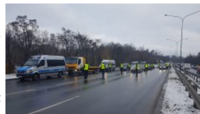
Działania "Trzeźwość" #2