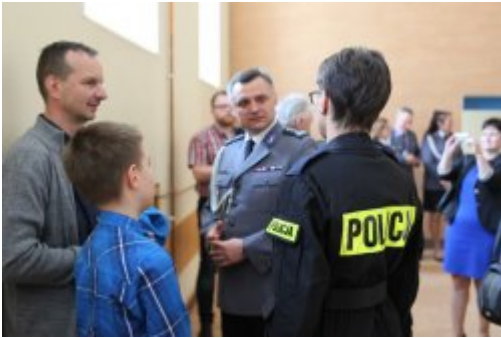
Wybrali mundur #14