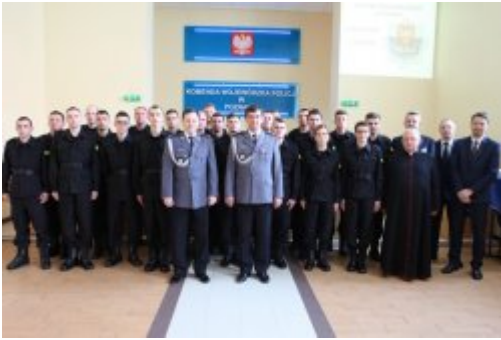
Wybrali mundur #12