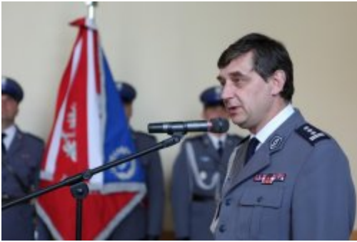
Wybrali mundur #7