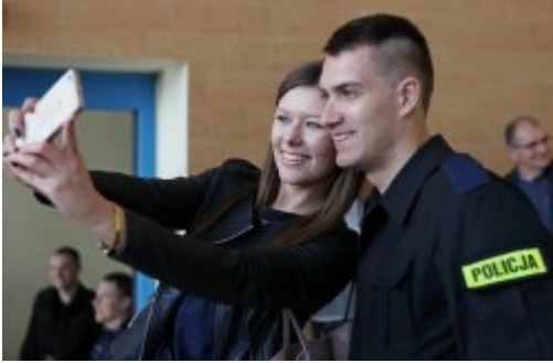
Wybrali mundur #18