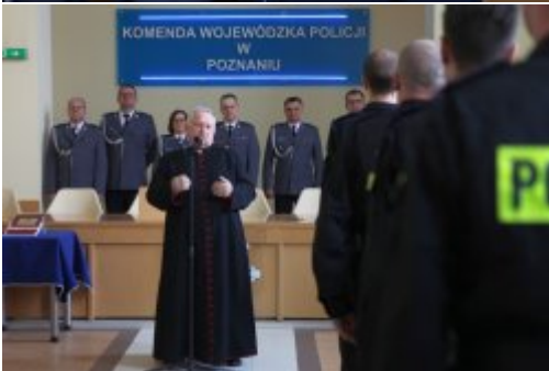
Wybrali mundur #11