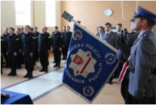
Wybrali mundur #2