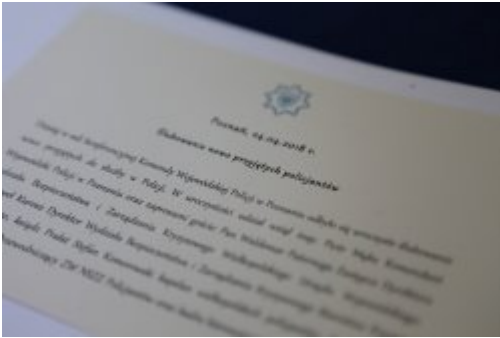
Wybrali mundur #9