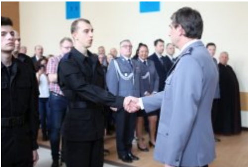
Wybrali mundur #5