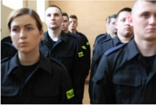
Wybrali mundur #8