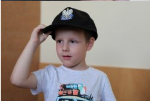
Wybrali mundur #16