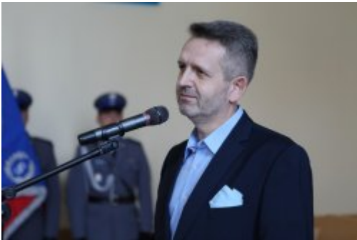
Wybrali mundur #10