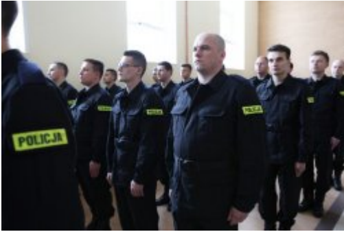
Wybrali mundur #3