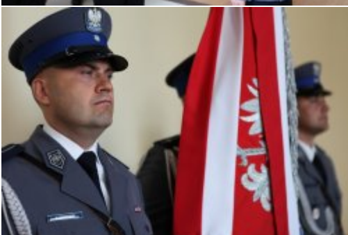
Wybrali mundur #6