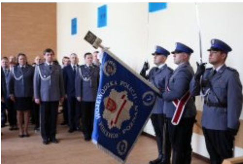
Wybrali mundur #1