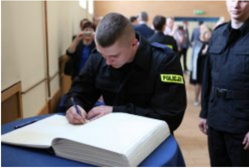
Wybrali mundur #13