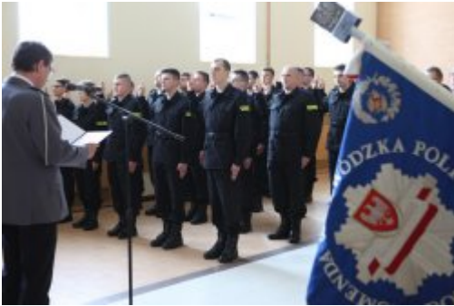
Wybrali mundur #4