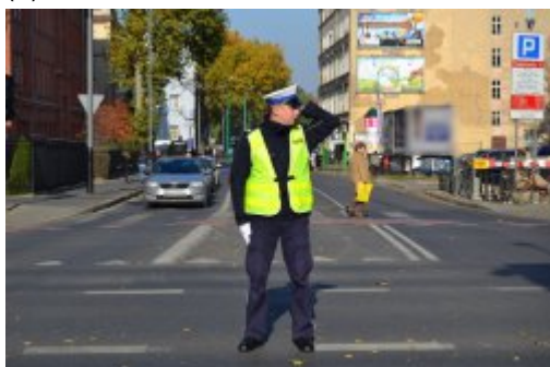
Światło zielone - ruch otwarty dla nadjeżdżających z prawej i lewej policjanta