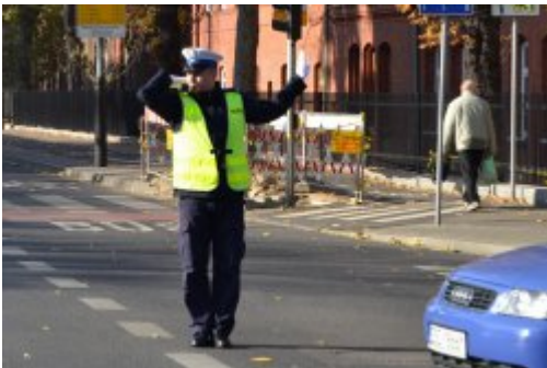
światło zielone dla jadących z prawej strony policjanta (prosto i w lewo), policjant dodatkowo wstrzymuje ruch z jego lewej strony