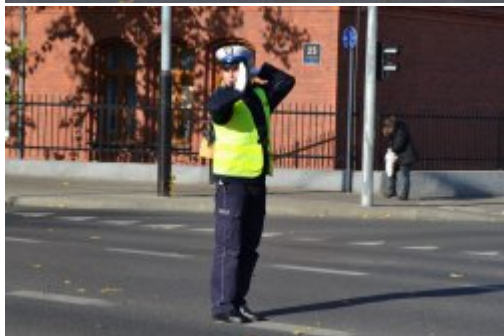
Światło zielone - ruch otwarty dla nadjeżdżających z prawej i lewej policjanta