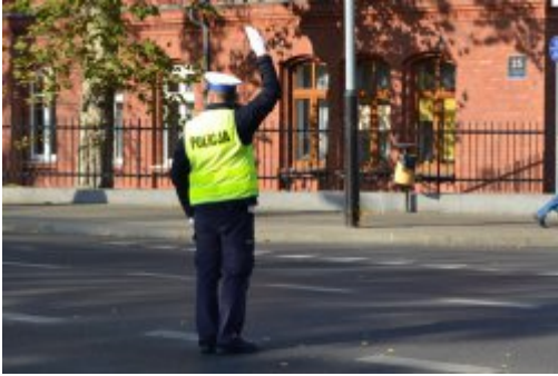
Światło żółte - nastąpi zmiana kierunku jazdy (2)