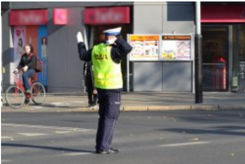
światło zielone dla jadących z prawej strony policjanta (prosto i w lewo), policjant dodatkowo wstrzymuje ruch z jego lewej strony (2)