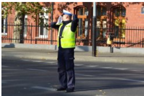
Światło zielone - ruch otwarty dla nadjeżdżających z prawej i lewej policjanta