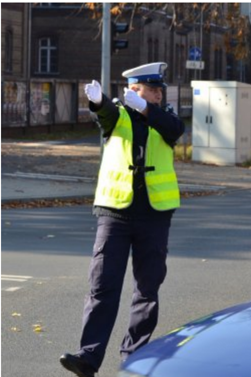
światło zielone dla jadących z lewej strony policjanta (prosto i w lewo), dla innych kierunków zakaz jazdy (3)