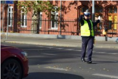
światło zielone dla jadących z prawej strony policjanta (prosto i w lewo), policjant dodatkowo wstrzymuje ruch z jego lewej strony (2)