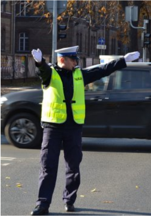
światło zielone dla jadących z lewej strony policjanta (prosto i w lewo), dla innych kierunków zakaz jazdy (2)