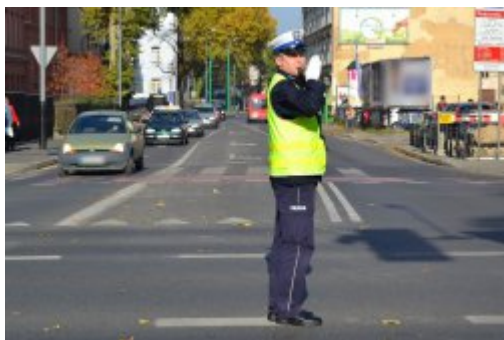
Światło zielone - jedź