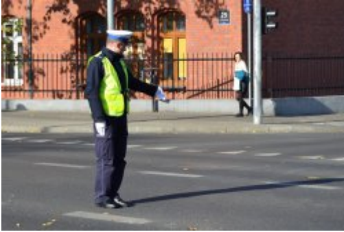
światło zielone - ruch otwarty dla nadjeżdżających z prawej i lewej strony policjanta; policjant wskazuje miejsce do zatrzymania się dla pojazdów nadjeżdżających z jego lewej strony z zamiarem skrętu w lewo