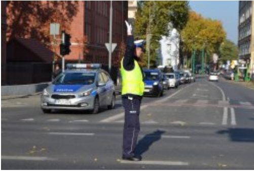
Światło żółte - nastąpi zmiana kierunku jazdy (2)