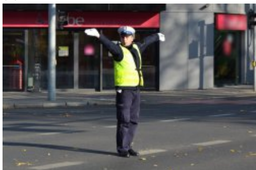
Światło zielone - ruch otwarty dla nadjeżdżających z prawej i lewej policjanta