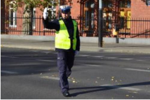
światło zielone dla jadących z lewej strony policjanta; policjant dodatkowo wstrzymuje ruch z jego prawej strony