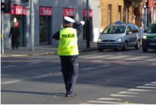
światło zielone dla jadących z lewej strony policjanta (prosto i w lewo), dla innych kierunków zakaz jazdy